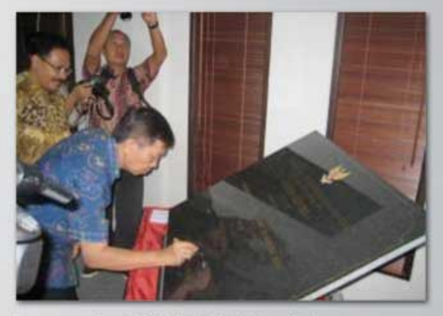
Peresmian PUSDALOPS oleh Gubernur Bali