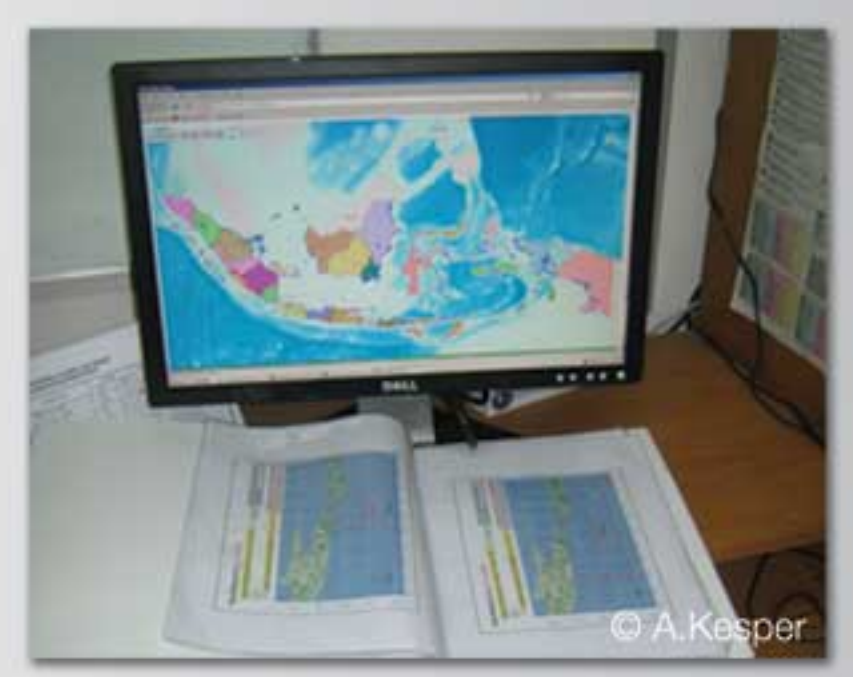
SOP untuk Penyebaran Peringatan