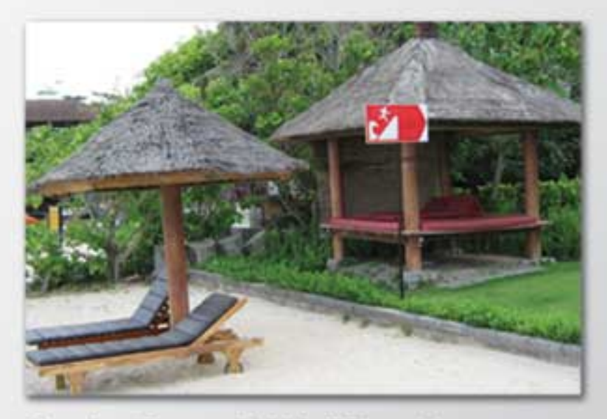
Rambu Tsunami BHA di Pantai