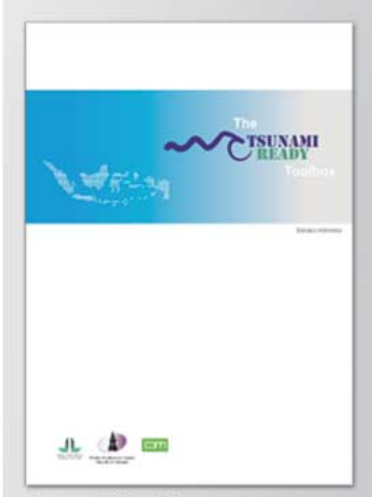
Tsunami Tool Box