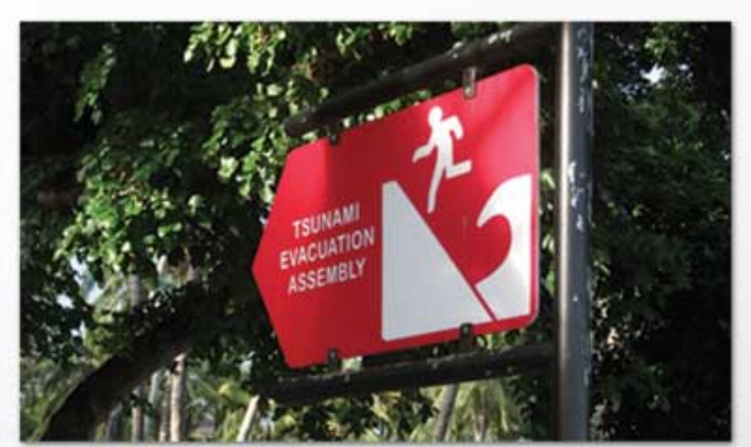
Rambu Tsunami di Pantai

T: +62-21-2358 7111 F: +62-21-2358 7110 E: gtz-indonesien@gtz.de I: www.gtz.de/indonesia