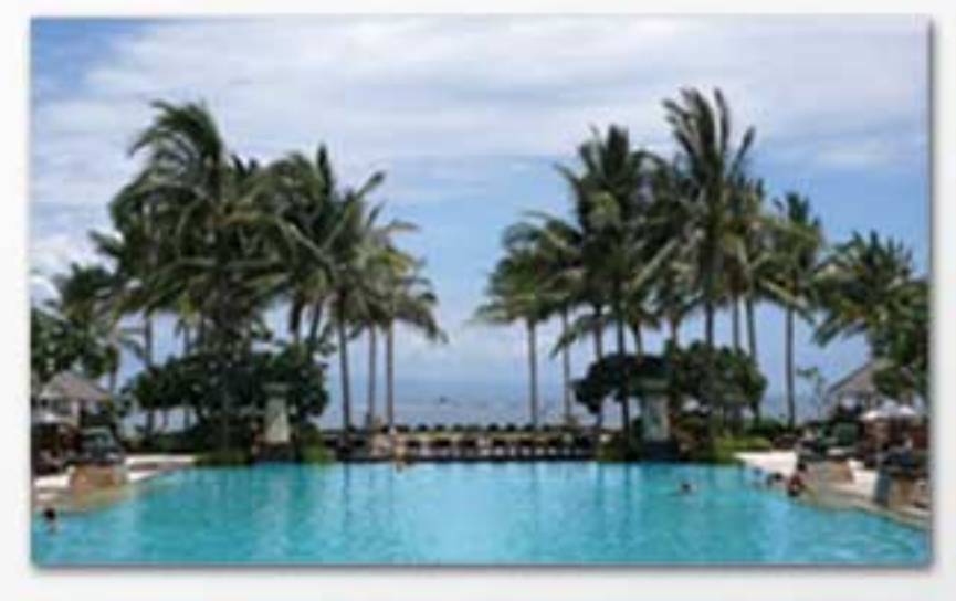
Hotel Anggota BHA di Bali

Prakarsa 'Tsunami Ready' oleh BUDPAR dan BHA telah terpilih sebagai contoh praktis dari 'Kemitraan Swasta Publik dalam Pengurangan Risiko Bencana' oleh International Strategy for Disaster Reduction (ISDR), badan PBB.