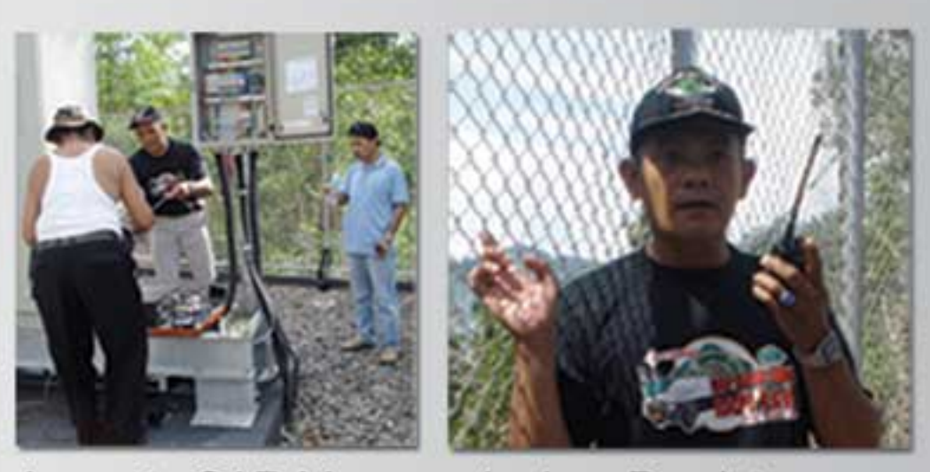
Anggota SAR Mempersiapkan Peralatan