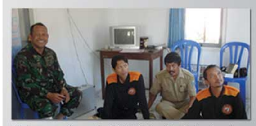
Pertemuan Anggota SAR di Pos Angkatan Laut